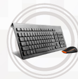
Lenovo Professional Wireless-Kombination