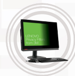
Lenovo Blichschutzfilter von 3M für ThinkCentre AIO